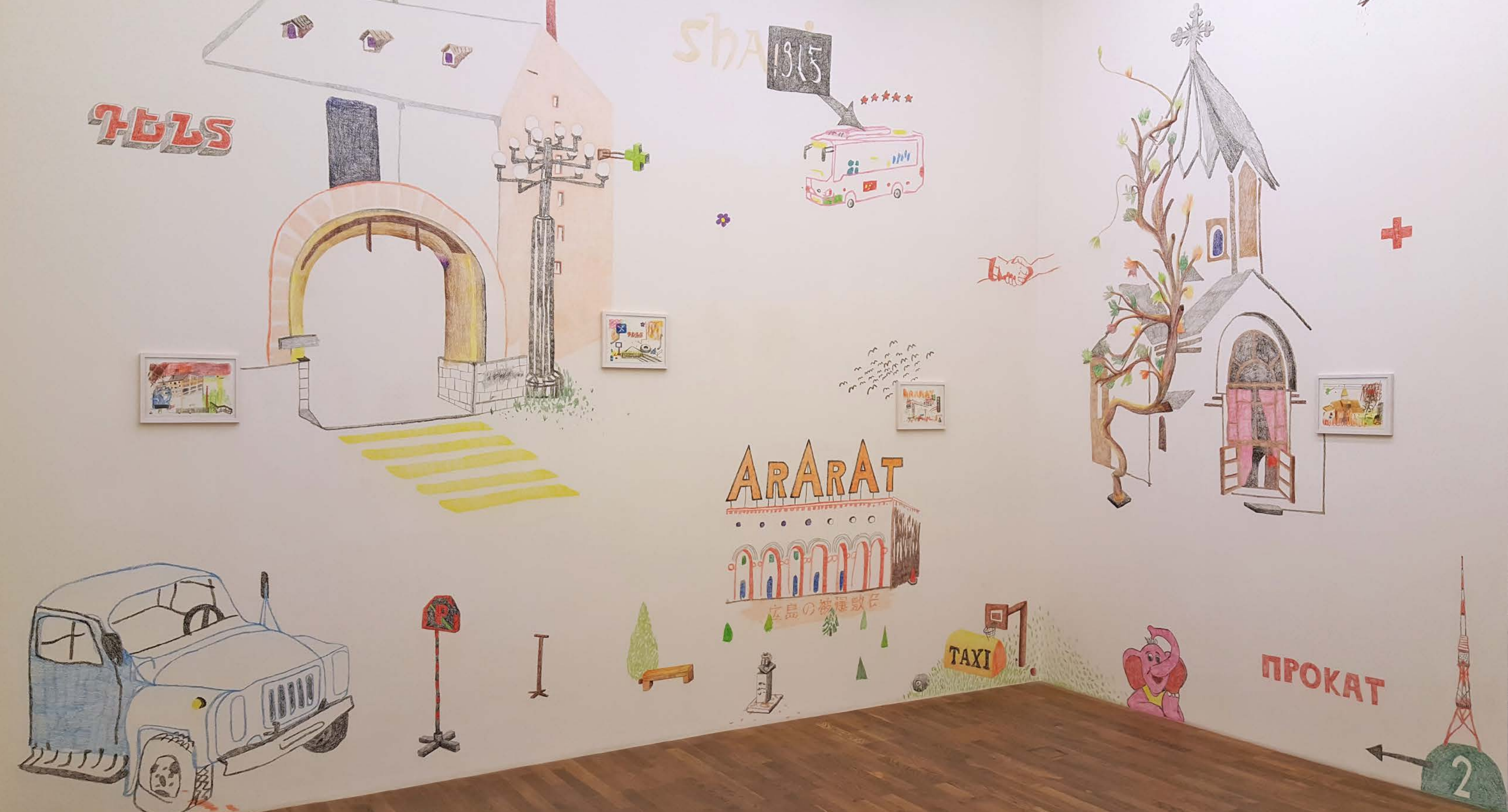
Yerevan to go | Buntstift auf Wand und Papier | Ausstellungsansicht | IN YOUR EYES | 2017