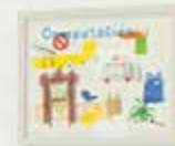
BIENVENIDOS Serie von Zeichnungen | 16 Teilig Buntstift auf Papier Größe je Blatt 29,7 x 21 cm