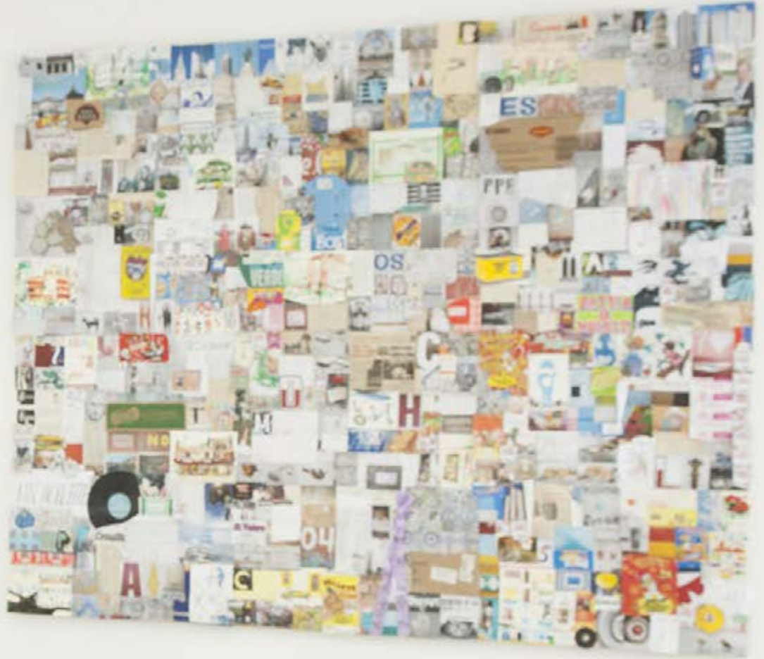
ACUMULACIÓN Wandinstallation | 12 Teilig Größe ca. 300 x 400 cm Fotos, gefundene Objekte, Zeichnungen, Pinnwandnadeln