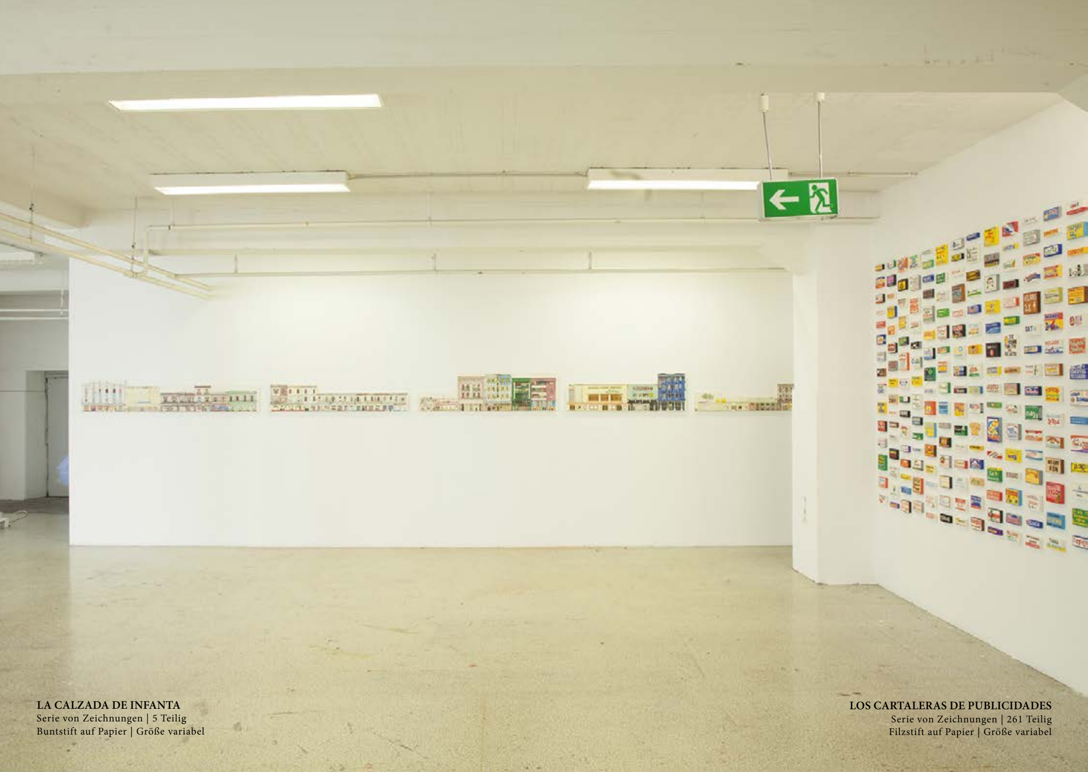
LA CALZADA DE INFANTA Serie von Zeichnungen | 5 Teilig Buntstift auf Papier | Größe variabel